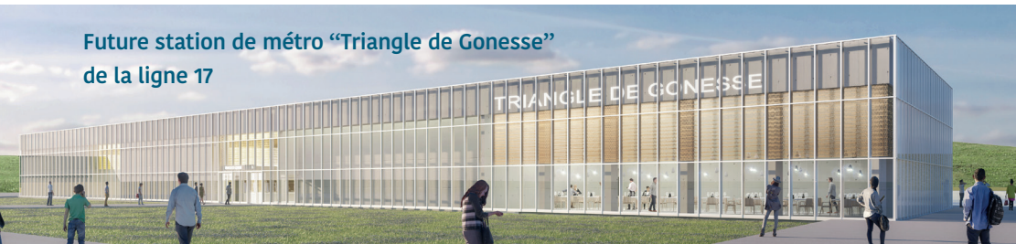
Future station de métro "Triangle de Gonesse" de la ligne 17