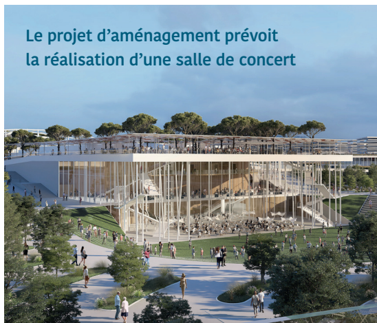
Le projet d'aménagement prévoit la réalisation d'une salle de concert