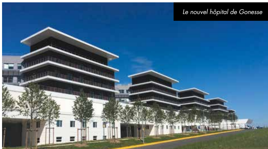
Le nouvel hôpital de Gonesse

Jean-Pierre Blazy, Député-Maire de Gonesse