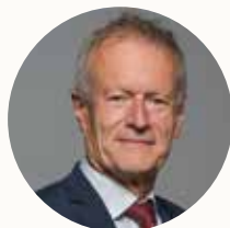
Jean-Pierre Blazy Maire de Gonesse