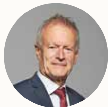
Jean-Pierre Blazy Maire de Gonesse