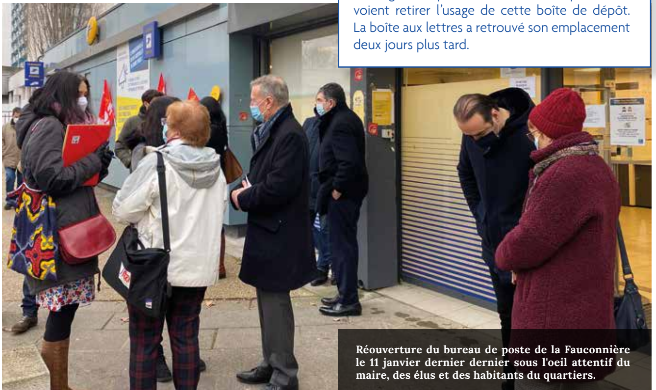
Réouverture du bureau de poste de la Fauconnière le 11 janvier dernier sous l'oeil attentif du maire, des élus et des habitants du quartiers.

Au moment où le bureau de la Fauconnière accueillait de nouveau des usagers, la mairie a constaté que la boîte aux lettres du centre-ville avait été retirée. Cette disparition a immédiatement été signifiée à la direction du groupe La Poste, arguant qu'il n'était pas envisageable que les habitants du quartier se voient retirer l'usage de cette boîte de dépôt. La boîte aux lettres a retrouvé son emplacement deux jours plus tard.