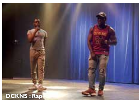
DCKNS : Rap