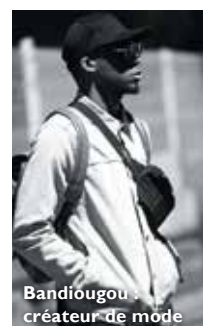
Bandiougou : créateur de mode