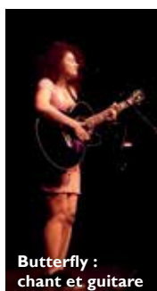
Butterfly : chant et guitare