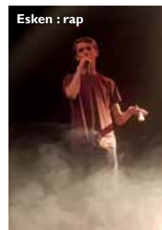
Esken : rap