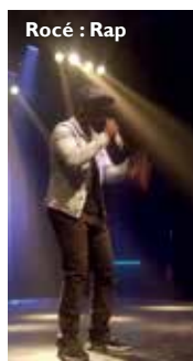
Rocé : Rap