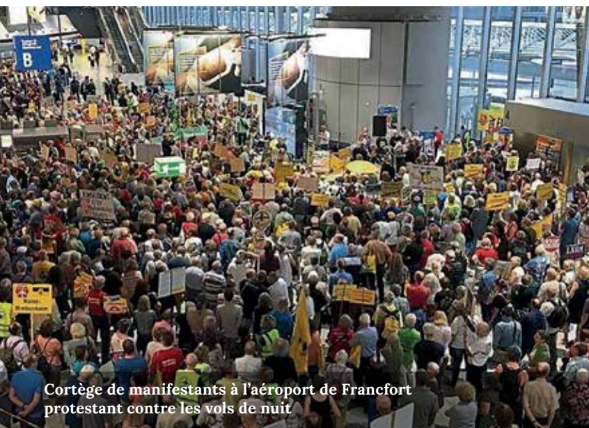
Cortège de manifestants à l'aéroport de Francfort protestant contre les vols de nuit

Une action de sensibilisation sera organisée cet automne à Paris pour défendre la négociation d'un couvre-feu à Roissy-Charles-de-Gaulle. A cette occasion, les élus et représentants d'association de l'aéroport de Francfort viendront apporter leur précieux soutien.