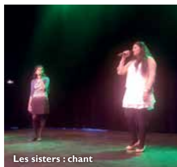
Les sisters : chant