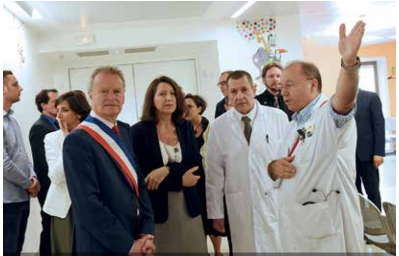
La visite des services a permis à des agents hospitaliers de présenter les avantages du nouveau bâtiment mais aussi les difficultés liées au manque de personnel.

“ Le second sujet de préoccupation est le groupement hospitalier de territoire (GHT). Disons-le tout net. Nous n'avons toujours pas compris pourquoi l'ARS a cru bon de décider un mariage forcé entre Gonesse et Saint-Denis. Et décider que nous ne pouvions être l'établissement support au seul motif que nous nous étions endettés avec la construction que nous inaugurons aujourd'hui ! [...] ”