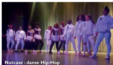
Nutcase : danse Hip-Hop

Samedi 26 mai, la 3 e édition de la soirée Jeunes talents a rassemblé 300 personnes à la salle Jacques Brel ! L'occasion pour de nombreux jeunes de monter sur scène pour montrer de quoi ils sont capables. Les danseuses de l'association NUTCASE qui ont enflammé la salle avec un numéro inventif plein d'énergie ont remporté le Coup de cœur du public et assureront donc la première partie d'un spectacle professionnel de la prochaine saison culturelle.