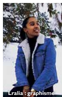
Lralia : graphisme