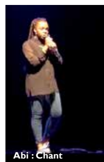
Abi : Chant