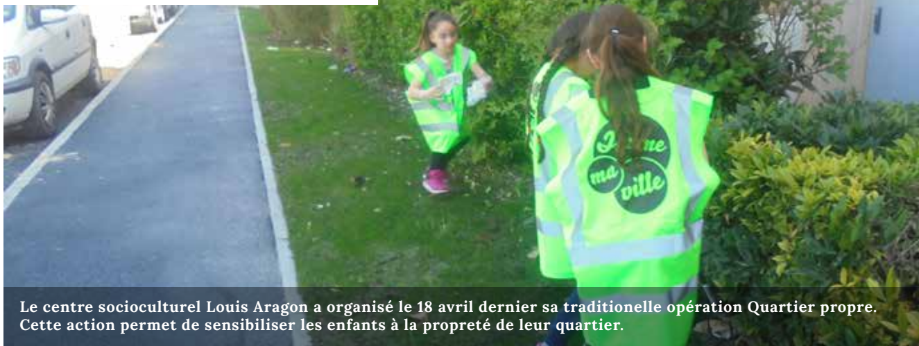
Le centre socioculturel Louis Aragon a organisé le 18 avril dernier sa traditionnelle opération Quartier propre. Cette action permet de sensibiliser les enfants à la propreté de leur quartier.