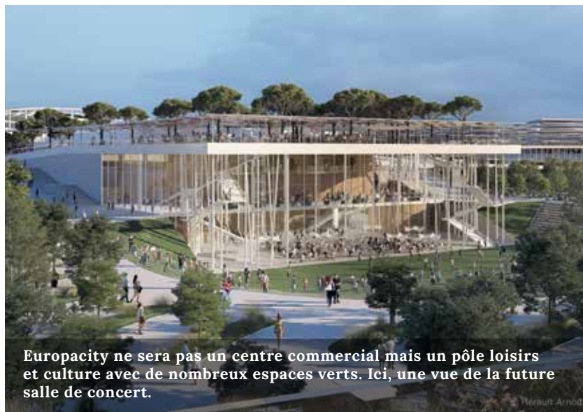
Europacity ne sera pas un centre commercial mais un pôle loisirs et culture avec de nombreux espaces verts. Ici, une vue de la future salle de concert.

décision et les études d'impact jugées insuffisantes seront complétées. Les différentes procédures se poursuivent par ailleurs avec notamment le dépôt du permis de construire de la gare du métro le 18 avril dernier.