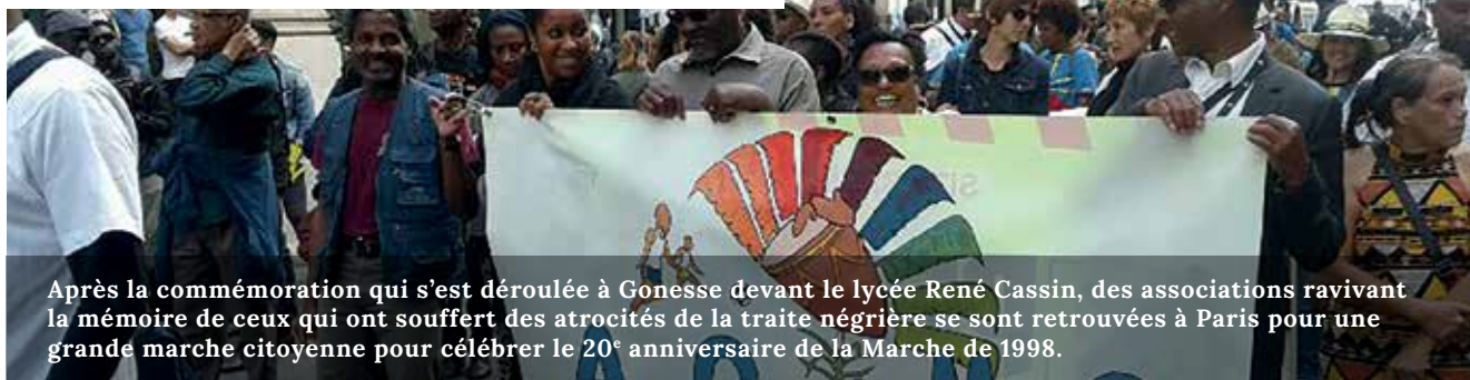
Après la commémoration qui s'est déroulée à Gonesse devant le lycée René Cassin, des associations ravivant la mémoire de ceux qui ont souffert des atrocités de la traite négrière se sont retrouvées à Paris pour une grande marche citoyenne pour célébrer le 20 e anniversaire de la Marche de 1998.

23 mai : journée nationale en hommage aux victimes de l'esclavage colonial