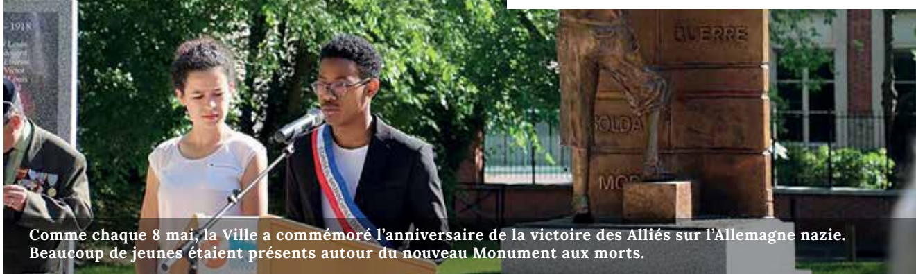
Comme chaque 8 mai, la Ville a commémoré l'anniversaire de la victoire des Alliés sur l'Allemagne nazie. Beaucoup de jeunes étaient présents autour du nouveau Monument aux morts.

23 mai : journée nationale en hommage aux victimes de l'esclavage colonial