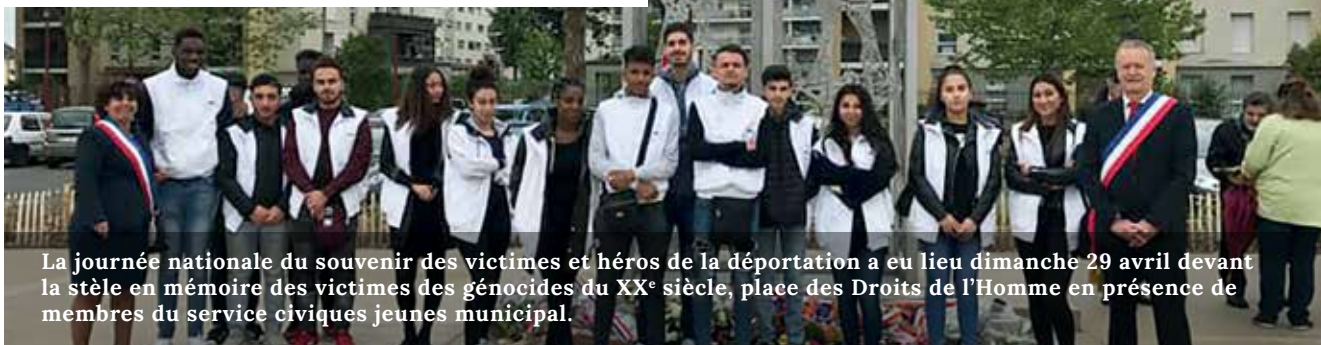
La journée nationale du souvenir des victimes et héros de la déportation a eu lieu dimanche 29 avril devant la stèle en mémoire des victimes des génocides du XX e siècle, place des Droits de l'Homme en présence de membres du service civiques jeunes municipal.