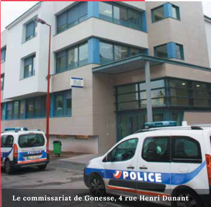
Le commissariat de Gonesse, 4 rue Henri Dunant

Il sera constitué d'habitants volontaires qui auront pour but de transmettre les informations auprès des habitants de leurs quartiers et recenser les difficultés rencontrées, que ce soit de l'insécurité pure ou des incivilités.