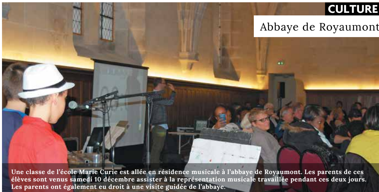
Une classe de l'école Marie Curie est allée en résidence musicale à l'abbaye de Royaumont. Les parents de ces élèves sont venus samedi 10 décembre assister à la représentation musicale travaillée pendant ces deux jours. Les parents ont également eu droit à une visite guidée de l'abbaye.