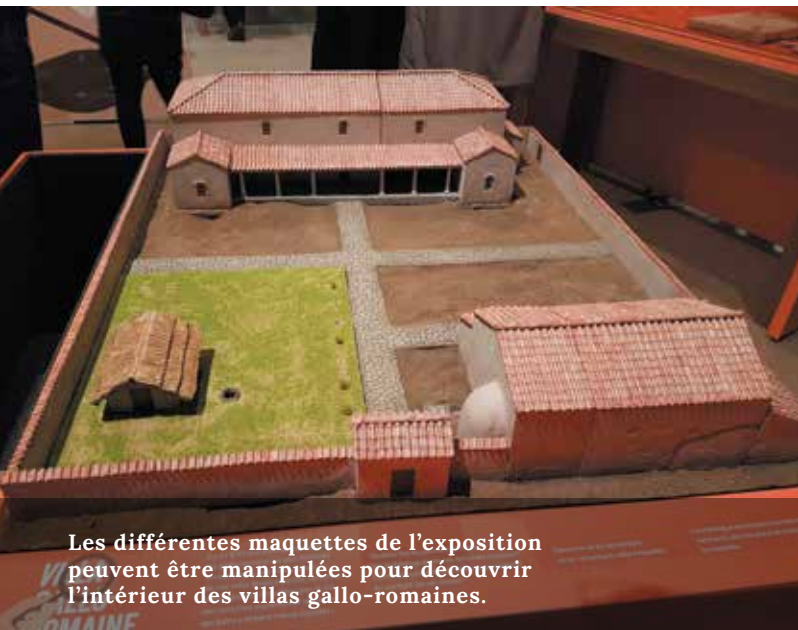
Les différentes maquettes de l'exposition peuvent être manipulées pour découvrir l'intérieur des villas gallo-romaines.