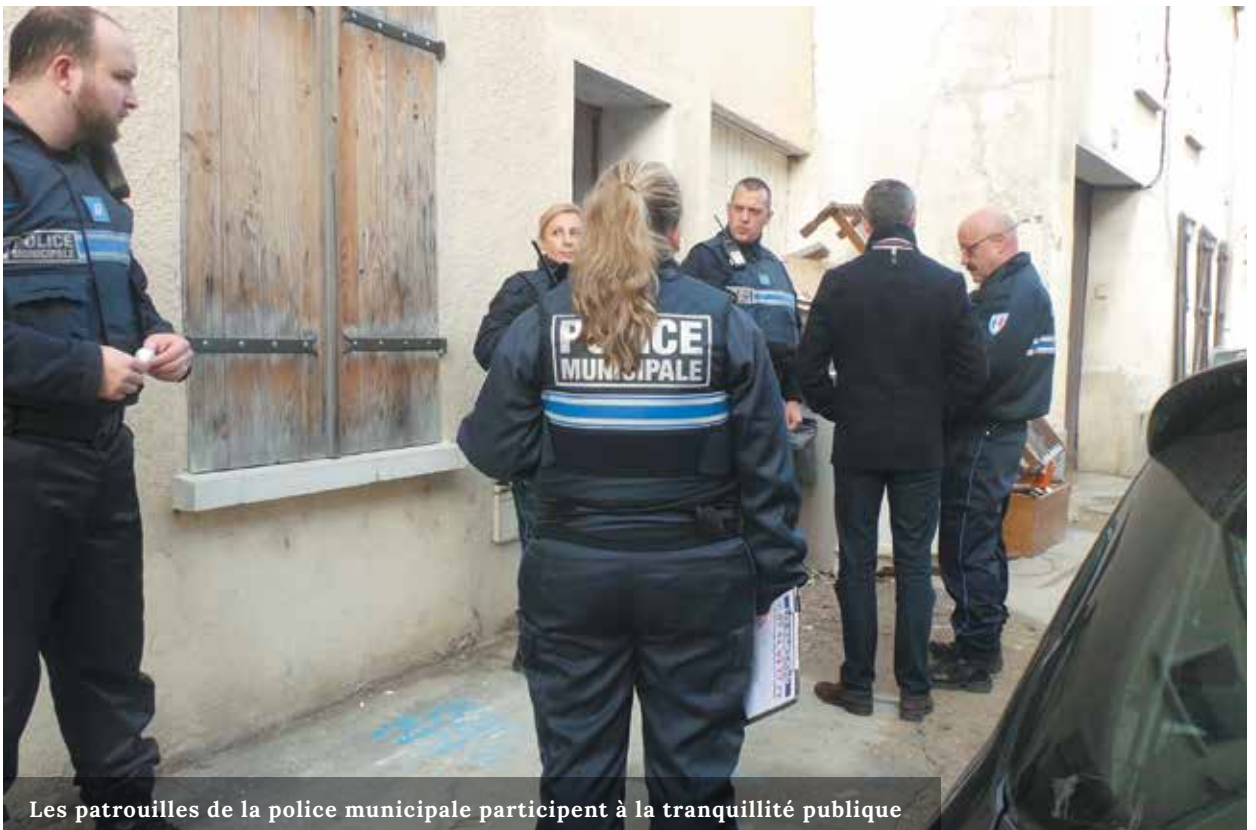
Les patrouilles de la police municipale participent à la tranquillité publique

La nouvelle stratégie de sécurité et de prévention de la délinquance fixe les grands objectifs mais aussi les moyens d'atteindre ces objectifs. Validée et signée par la Ville et ses partenaires en matière de sécurité (la sous-préfecture, le parquet, le conseil départemental et l'Inspection Académique de l'Education Nationale), elle formalise un certain nombre d'actions nouvelles et d'autres déjà engagées.