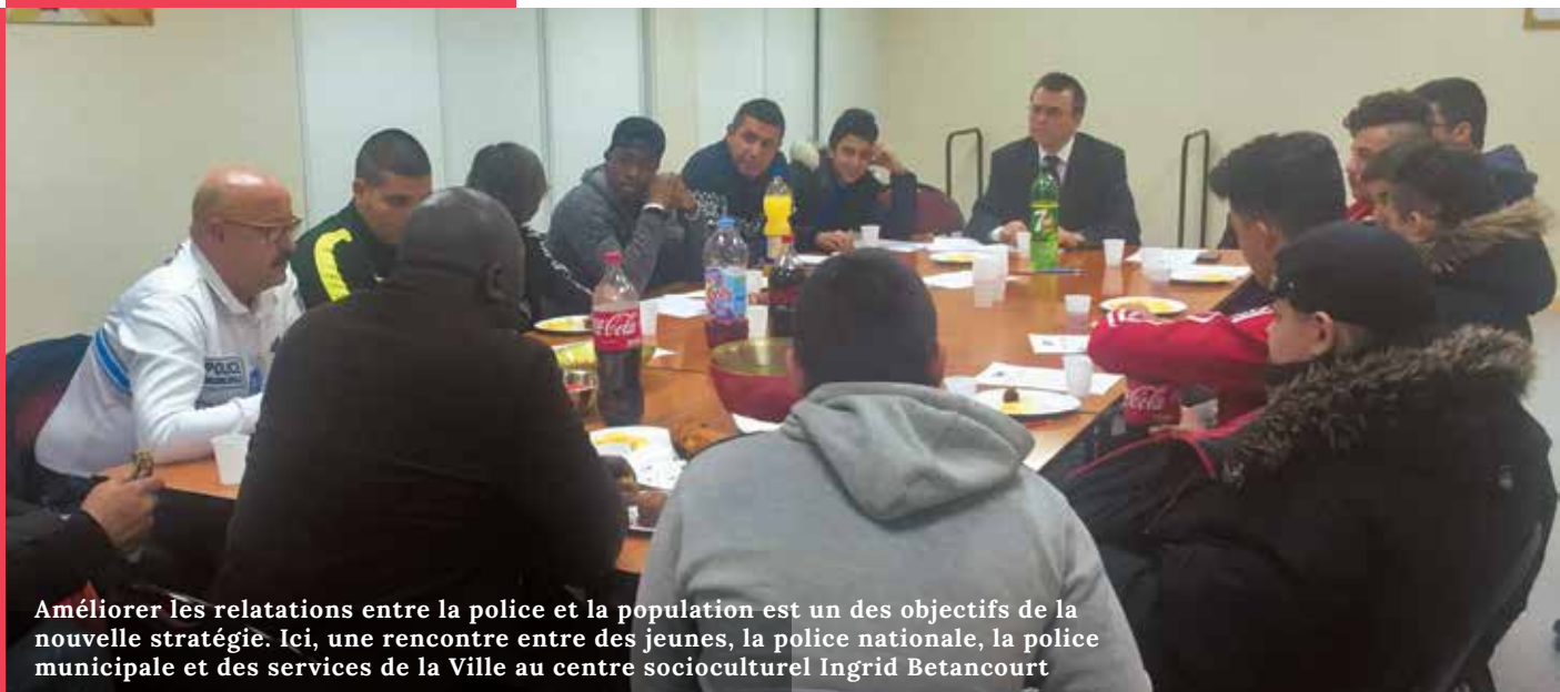
Améliorer les relations entre la police et la population est un des objectifs de la nouvelle stratégie. Ici, une rencontre entre des jeunes, la police nationale, la police municipale et des services de la Ville au centre socioculturel Ingrid Betancourt