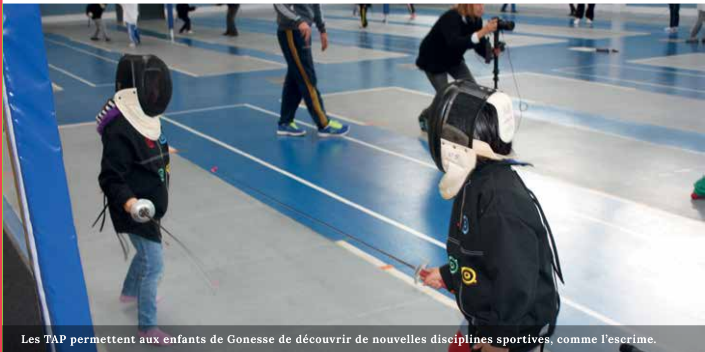
Les TAP permettent aux enfants de Gonesse de découvrir de nouvelles disciplines sportives, comme l'escrime.

Depuis le 3 septembre 2013, les écoliers gonessiens vivent la semaine de quatre jours et demi. Cette demi-journée supplémentaire permet d'alléger de 45 minutes le temps d'enseignement des quatre autres jours de la semaine. Les journées d'enseignement sont donc de 5h15 les lundis, mardis, jeudis et vendredis et de 3h le mercredi matin. Les Temps d'Activités Périscolaires (TAP) d'une durée d'1h15, sont pris en charge par la Ville et sont organisés deux fois par semaine dans toutes les écoles. « Nous