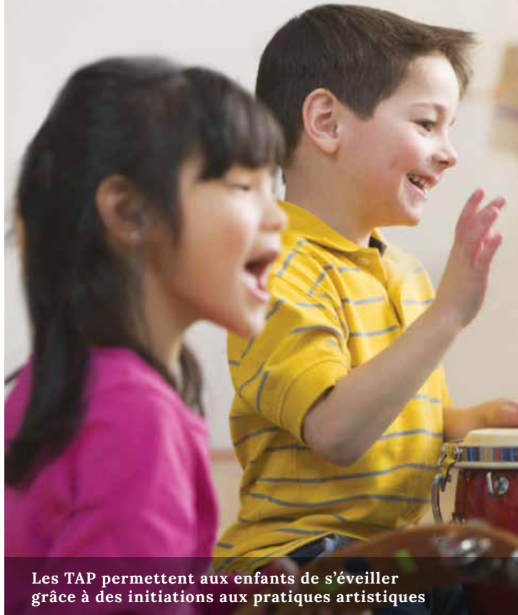
Les TAP permettent aux enfants de s'éveiller grâce à des initiations aux pratiques artistiques

L'éducation est depuis longtemps une priorité de la municipalité. Elle l'a montré concrètement en développant un partenariat fort avec l'Education nationale. Celui-ci se traduit par une mise à disposition de moyens matériels et humains sur les plans sportifs et culturels. La Ville soutient également financièrement les projets d'école, telles que les classes de découverte. En dehors du temps scolaire, elle assure des temps d'accueil où les enfants de la maternelle au CM2 profitent d'activités variées et éducatives (pré et post scolaires, centre de loisirs).