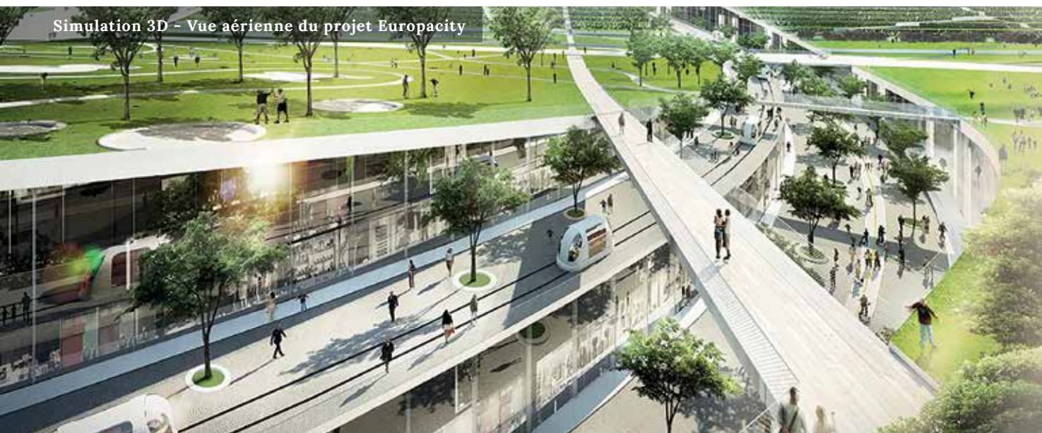
Simulation 3D - Vue aérienne du projet Europacity

D'après les estimations, Le Triangle de Gonesse permettra la création de plus de 50 000 emplois diversifiés, répartis entre le quartier d'affaires et EuropaCity, pour une ouverture prévue entre 2020 et 2024.