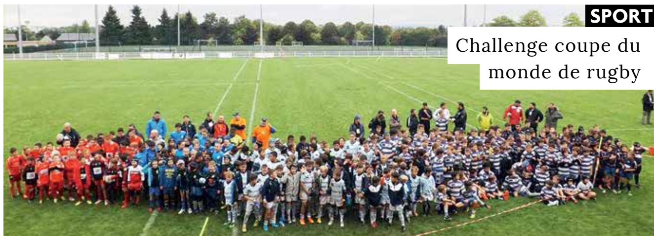
Le 13 septembre, le stade Cognevault a accueilli le challenge coupe du monde de rugby pour les catégories 10, 12 et 14 ans. 328 jeunes poudres de grands clubs franciliens se sont affrontés.