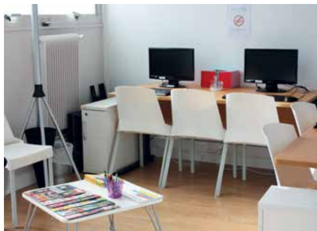
La MDA dispose d'une salle informatique en libre service pour les jeunes.

La Maison des adolescents est là pour aider les jeunes de 12 à 21 ans. L'équipe composée d'une psychologue, d'une infirmière, d'une monitrice-éducatrice, d'une secrétaire médico-sociale, d'un cadre et d'un médecin propose des entretiens individuels ainsi que des ateliers de prévention et d'expression. Depuis mi-septembre, la MDA est installée dans le bâtiment des entrées du centre hospitalier de Gonesse.