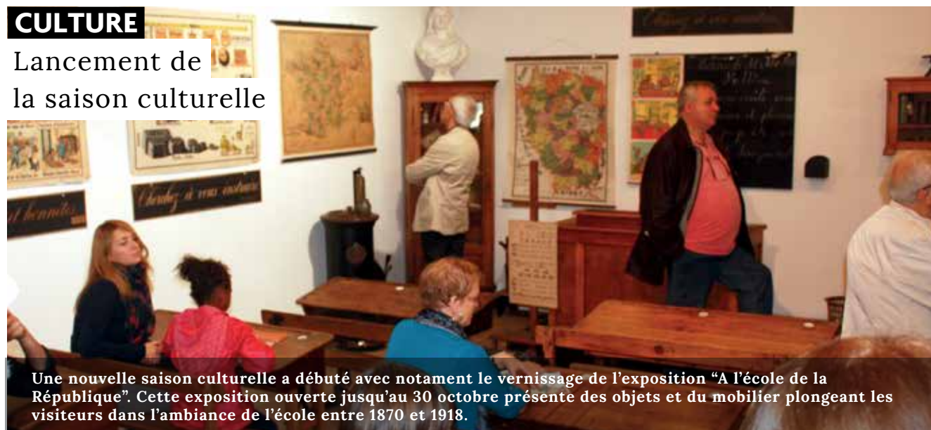
Une nouvelle saison culturelle a débuté avec notamment le vernissage de l'exposition "A l'école de la République". Cette exposition ouverte jusqu'au 30 octobre présente des objets et du mobilier plongeant les visiteurs dans l'ambiance de l'école entre 1870 et 1918.