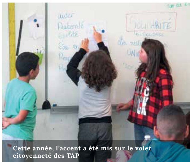
Cette année, l'accent a été mis sur le volet citoyenneté des TAP

L'éducation à la citoyenneté et à la laïcité, était depuis plusieurs années déjà, un volet bien présent dans les politiques éducatives à Gonesse. Les attentats du 7 janvier dernier ont rendu encore plus nécessaire le devoir d'enseigner les valeurs de la citoyenneté et du vivre ensemble. Dans ce contexte, la ville s'engage à multiplier ces ateliers à destination des élèves de primaire, persuadée que cette sensibilisation dès le plus jeune âge aura un effet bénéfique pour l'avenir. Le nombre de classes des écoles élémentaires bénéficiant de TAP « citoyenneté » a doublé pour cette première période par rapport à l'an passé.