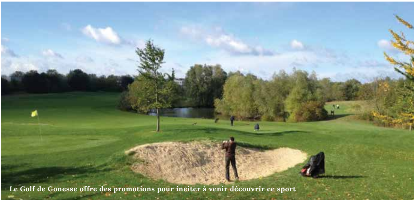
Le Golf de Gonesse offre des promotions pour inciter à venir découvrir ce sport

Le Golf de Gonesse cherche à casser l'image d'un sport pour privilégiés et propose des offres pour les débutants accessibles à toutes les bourses.