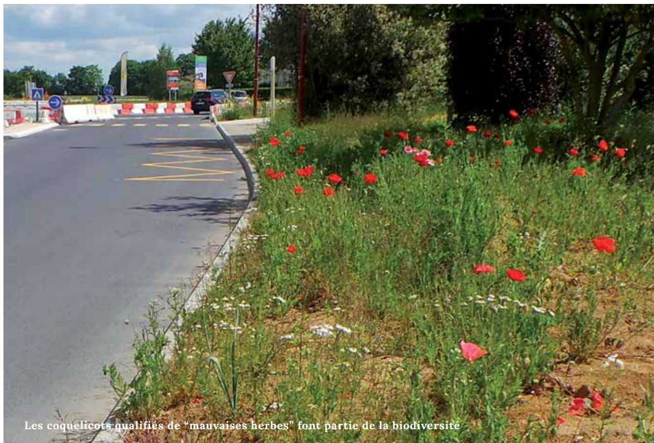
Les coquelicots qualifiés de « mauvaises herbes » font partie de la biodiversité

Avec l'entrée en vigueur de la loi Labbé en 2016, l'utilisation de produits phytosanitaires sera davantage règlementée. La ville de Gonesse se mobilise dès à présent.