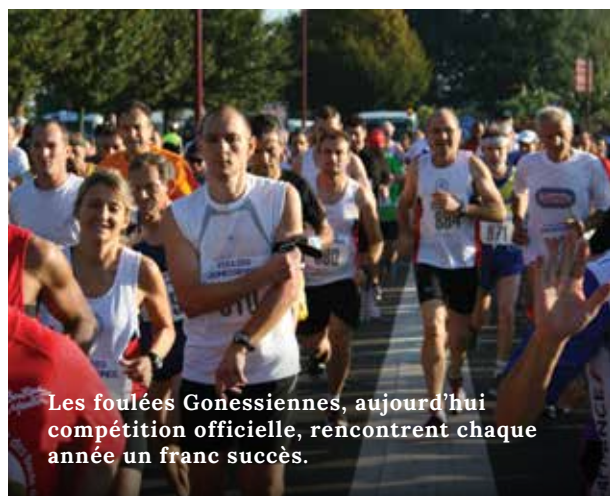
Les foulées Gonessiennes, aujourd'hui compétition officielle, rencontrent chaque année un franc succès.