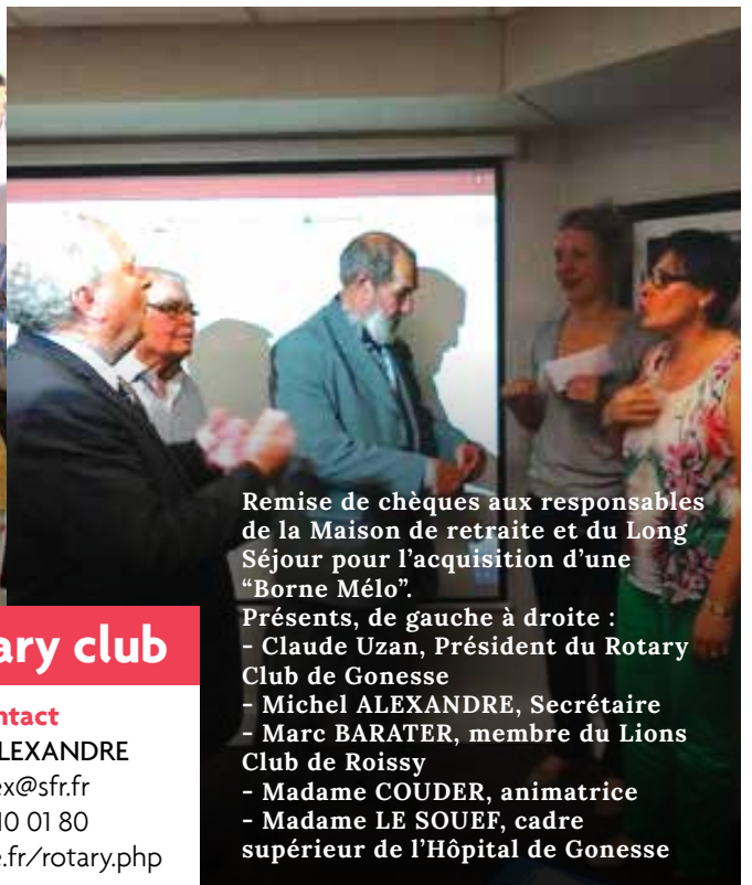
Remise de chèques aux responsables de la Maison de retraite et du Long Séjour pour l'acquisition d'une "Borne Mélo".