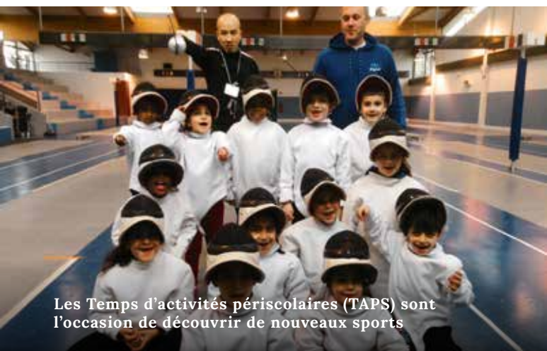
Les Temps d'activités périscolaires (TAPS) sont l'occasion de découvrir de nouveaux sports