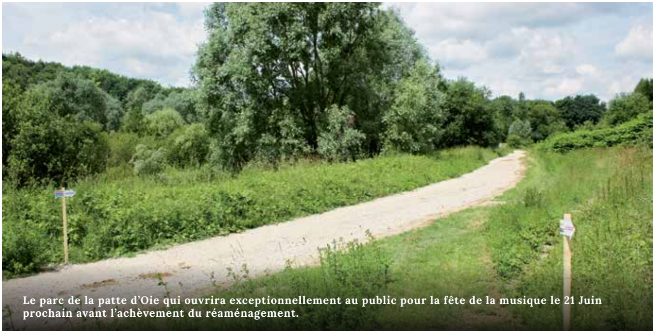
Le parc de la patte d'Oie qui ouvrira exceptionnellement au public pour la fête de la musique le 21 Juin prochain avant l'achèvement du réaménagement.

La commune de Gonesse a adopté le jeudi 9 avril la Charte régionale de la biodiversité. Elle a pour vocation d'être un outil d'engagement collectif et de valorisation à destination de l'ensemble des acteurs publics et privés franciliens.