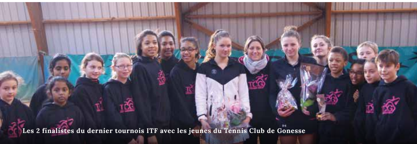
Les 2 finalistes du dernier tournois ITF avec les jeunes du Tennis Club de Gonesse