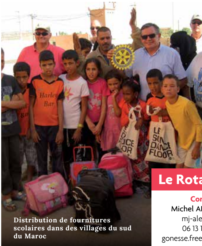
Distribution de fournitures scolaires dans des villages du sud du Maroc

Dans chaque édition, le Gonessien vous présente des acteurs associatifs de la Ville qui favorisent le « Vivre ensemble » à travers des actions solidaires, culturelles ou sportives. Ce mois-ci, le Rotary club de Gonesse qui a pour devise : « Servir ».