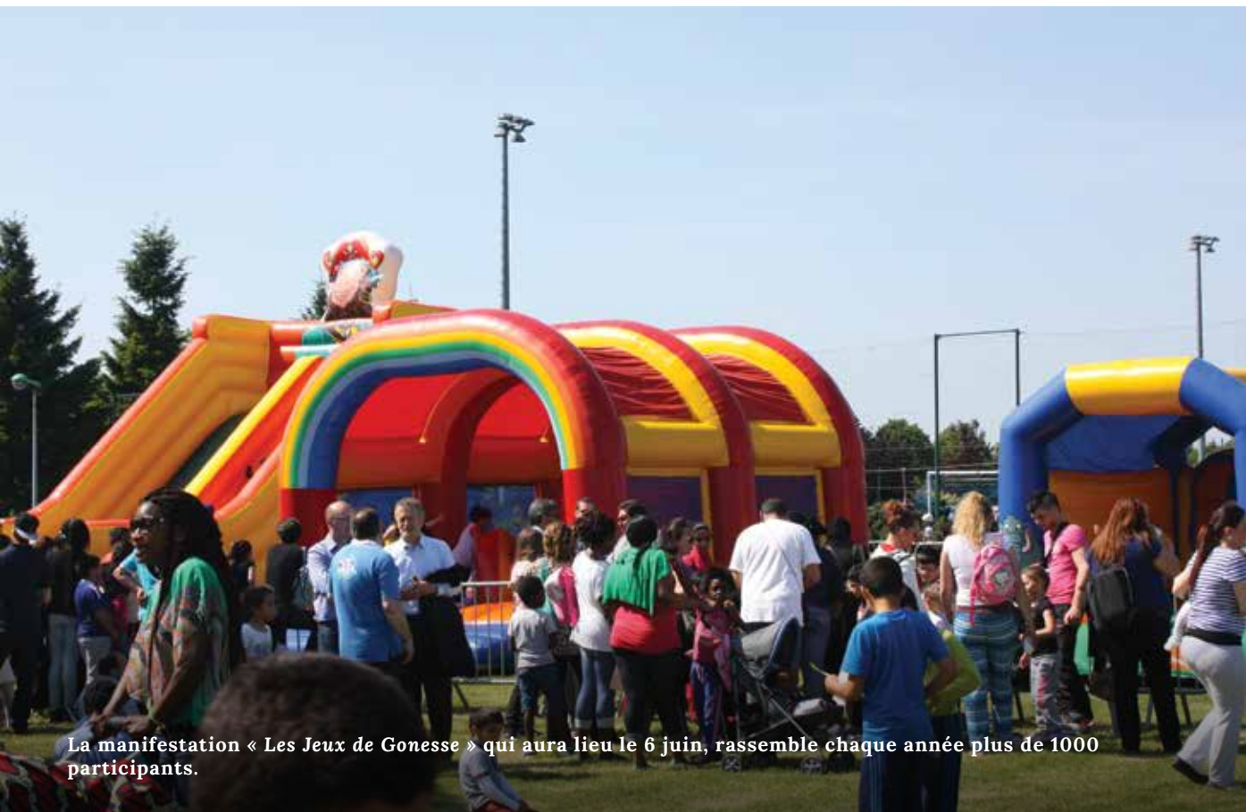
La manifestation « Les Jeux de Gonesse » qui aura lieu le 6 juin, rassemble chaque année plus de 1000 participants.