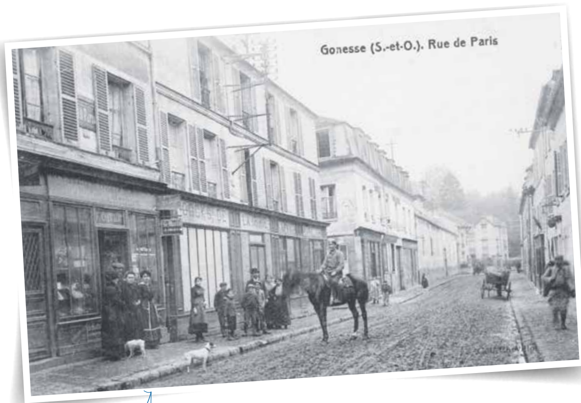
La rue de Paris vers 1915-1916

L'optimisme des premiers jours et la certitude d'une guerre courte ne sont plus de mise à l'automne: la ligne de front s'enlise dans les tranchées de la mer du Nord à la frontière suisse et l'on se prépare aux rigueurs de l'hiver. Le conseil municipal décide l'envoi de vêtements chauds pour nos soldats.