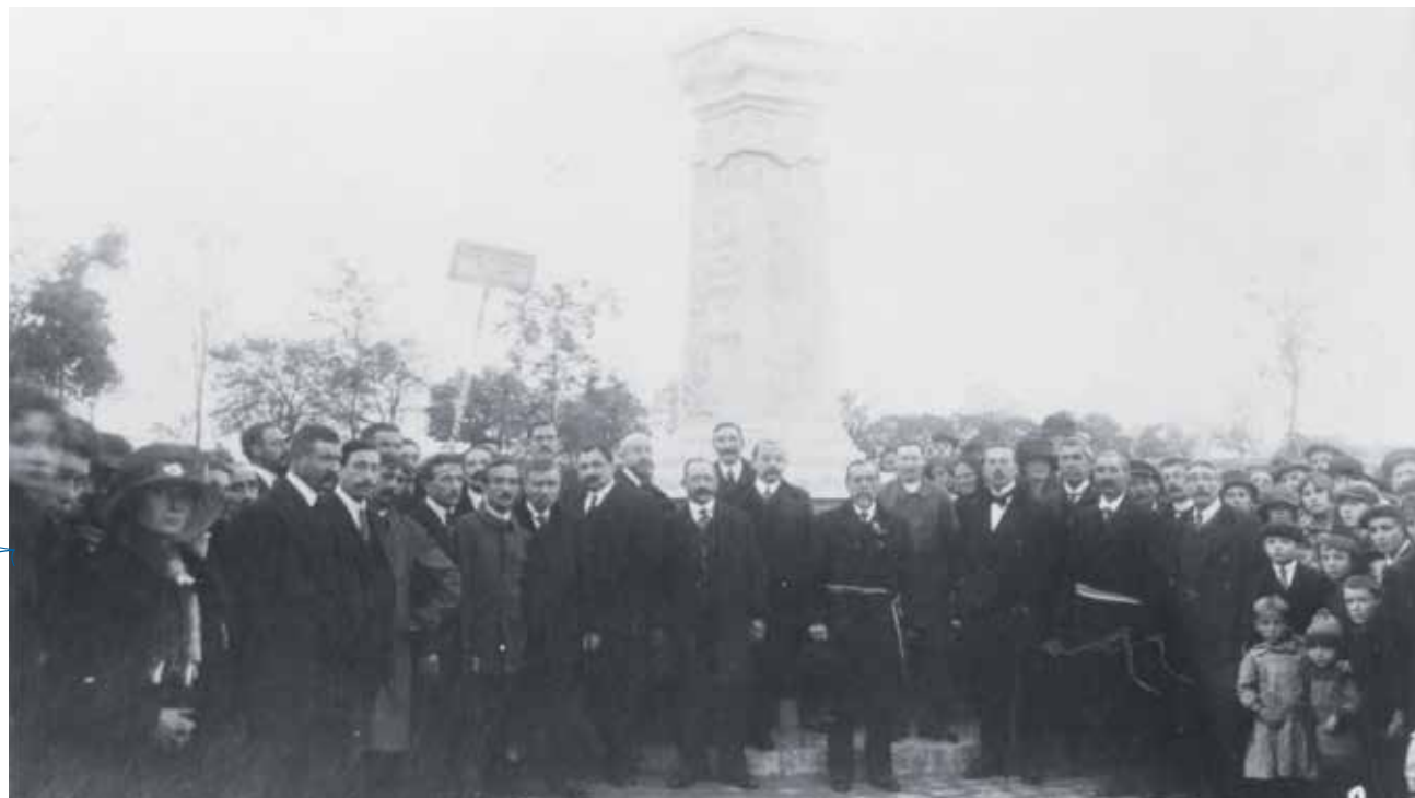
Inauguration du monument aux morts 1 er novembre 1920

cantonnements. Un événement va toutefois marquer l'année 1915. La ferme Tétard, située dans le bourg de Gonesse est la proie des flammes. En raison de la proximité d'une distillerie, l'incendie risque de se propager à d'autres locaux et habitations. Il est fort heureusement circonscrit, grâce à l'intervention des soldats qui ont participé à la lutte contre le feu.