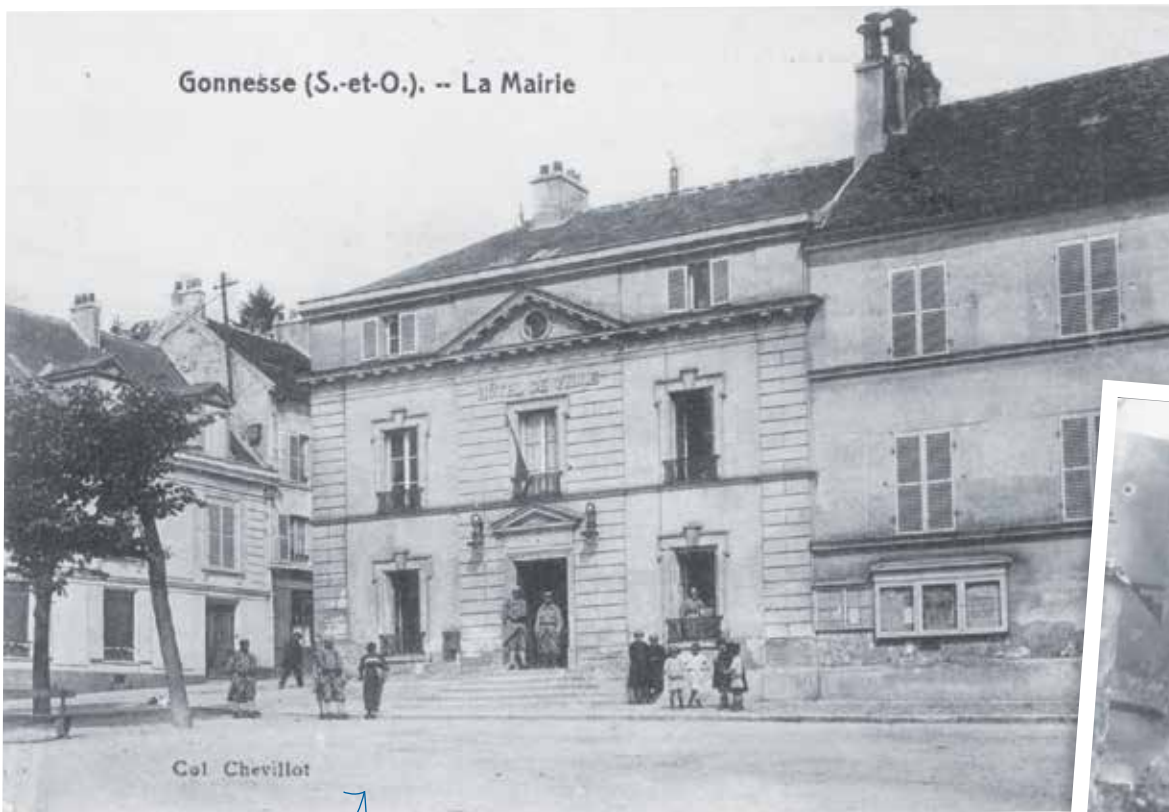
Soldats français devant l'hôtel de ville

L'été 1914 est marqué par une forte tension diplomatique que l'attentat de Sarajevo, le 28 juin, pousse à son paroxysme. À Gonesse, si l'on suit certainement l'évolution du drame