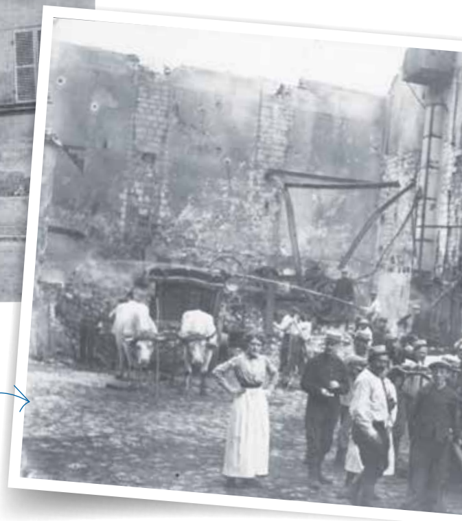
Incendie de la ferme Tétard à Gonesse en 1915