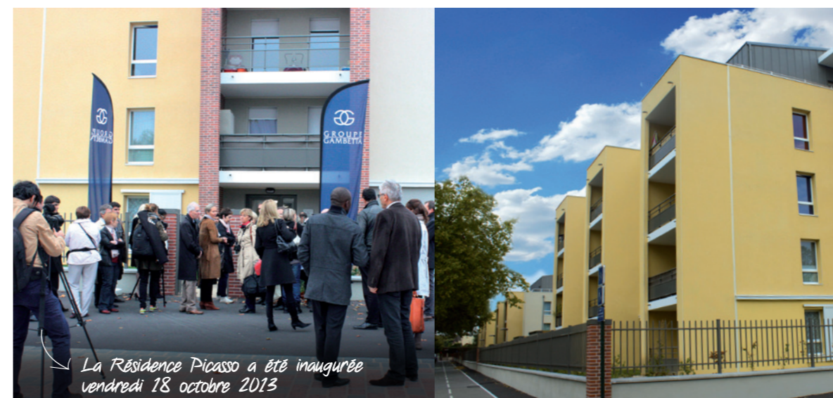
La Résidence Picasso a été inaugurée vendredi 18 octobre 2013