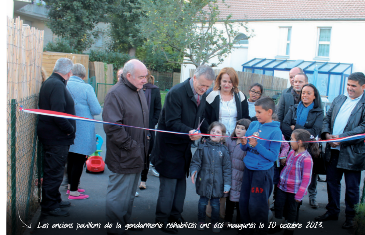
Les anciens pavillons de la gendarmerie réhabilités ont été inaugurés le 10 octobre 2013.

Après la fermeture de la gendarmerie de Gonesse et le départ début 2010 des derniers gendarmes de leurs logements de fonction, le bailleur Val d'Oise Habitat qui est devenu propriétaire des lieux a réalisé des travaux de réhabilitation des 13 logements. Les nouveaux locataires viennent d'emménager dans ces logements refaits à neuf.