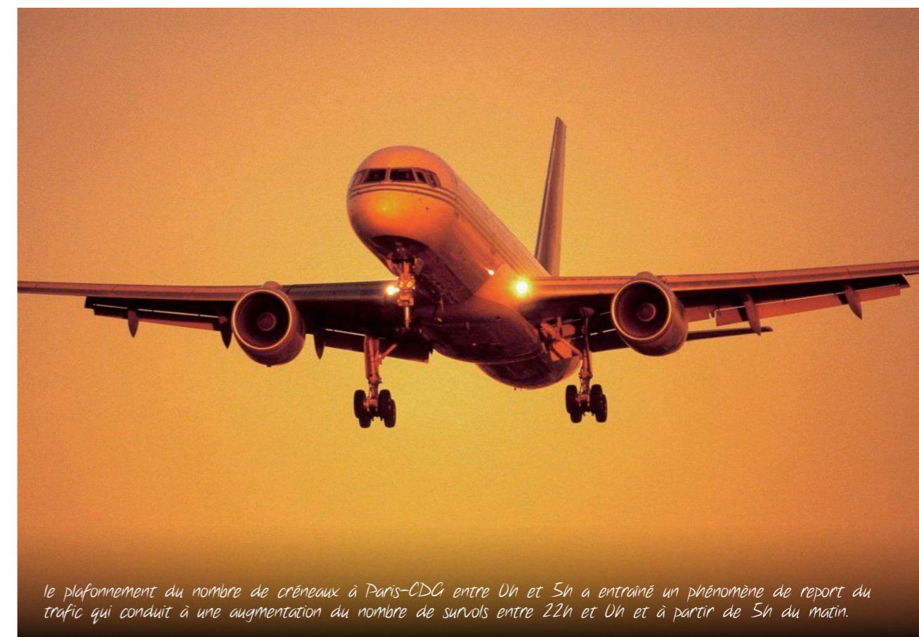
le plafonnement du nombre de créneaux à Paris-CDG entre 0h et 5h a entraîné un phénomène de report du trafic qui conduit à une augmentation du nombre de survols entre 22h et 0h et à partir de 5h du matin.