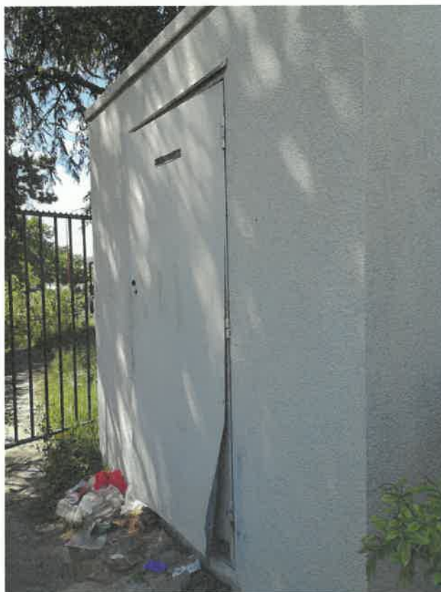
Avenue François Mitterrand