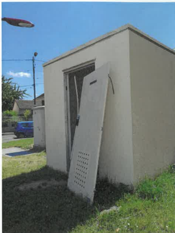
Rue Félix Chobert

Pièce jointe : photos des armoires prises le 20 mai 2020