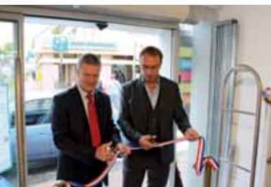
L'inauguration du commerce a eu lieu le 13 juin 2013.

Il y a un peu plus d'un an ouvrait le Casino shopping dans l'ancienne halle du marché. Depuis juin, c'est l'enseigne Calipage qui s'est installée au 55 rue de Paris. L'ouverture de ce commerce est le résultat de l'action de la Ville pour soutenir le commerce de proximité et faire face aux fermetures successives de la Maison de la presse puis d'Agora presse.