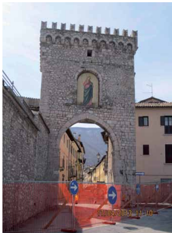
La Porta Spoletina à Leonessa