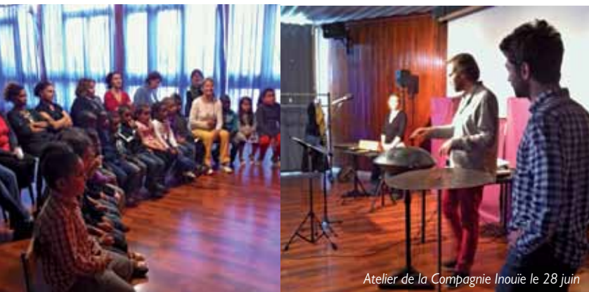
Atelier de la Compagnie Inouïe le 28 juin

Les compagnies "Théâtre sans Toit" et Inouïe en résidence depuis 3 ans sur la ville seront également partenaires et mèneront des actions autour de la musique et des marionnettes.