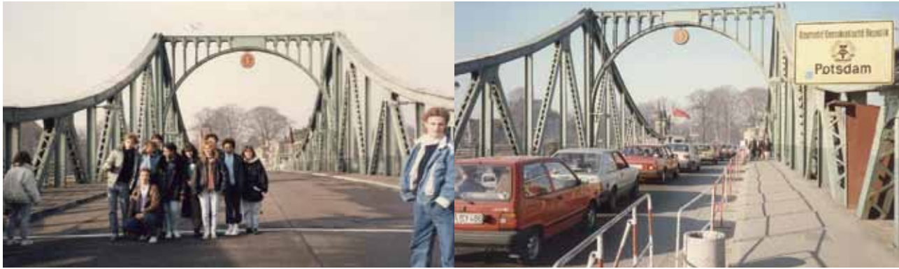
Le Pont de Gliencke ou "pont des espions" marquait la frontière entre Potsdam et Berlin jusqu'au 9 novembre 1989. En 1988, les élèves ne pouvaient franchir la ligne blanche (photo de gauche). En 1990, les élèves ont pu voir les automobilistes franchir la Havel (photo de droite).