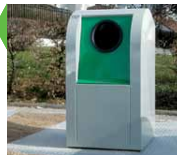
121 bacs enterrés pour ordures ménagères recyclables et non recyclables vont être installés dans le quartier de la Fauconnière.

La Gestion urbaine de proximité (GUP) est un engagement entre la ville de Gonesse, un bailleur social et l'Etat. Cet accord permet de coordonner voire renforcer les actions engagées en faveur du cadre de vie (entretien des espaces publics et collectifs privés etc.). À Gonesse, la GUP concerne 2184 logements dans le quartier de la Fauconnière, 674 à Saint-Blin – La Madeleine, et 835 logements en centre-ville. À noter enfin que ce plan a été renouvelé en 2011 et qu'il sera effectif jusqu'en 2013.