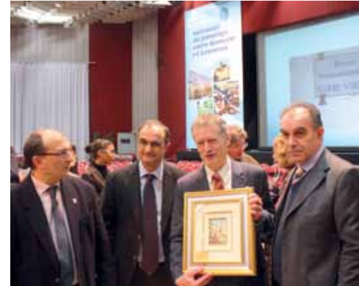
La cérémonie des vœux du maire 2011 s'est tenue en présence d'une délégation officielle de Leonessa.

Pour fêter les 30 ans du jumelage entre Gonesse et la commune italienne de Leonessa, la Ville invite une délégation de plus d'une centaine de Leonessani et prépare toute une semaine d'animations entre le 6 et le 11 mai.