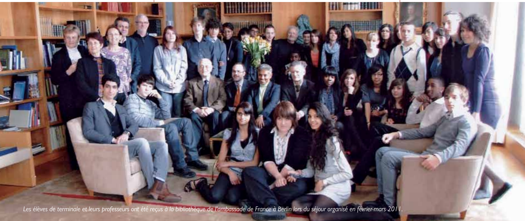
Les élèves de terminale et leurs professeurs ont été reçus à la bibliothèque de l'ambassade de France à Berlin lors du séjour organisé en février-mars 2011.

« Les échanges franco-allemands concrétisent ce que les élèves apprennent en cours, notamment dans la section européenne. L'apport est très important au niveau linguistique et culturel, mais aussi sur le plan civique. Lorsque nos lycéens ont été reçus à l'ambassade de France à Berlin, ils ont pris conscience qu'ils représentaient leur ville et leur pays. Ils ont également senti qu'ils appartenaient à un ensemble plus large, l'Europe, dont ils sont les citoyens de demain. Cet événement les a beaucoup valorisés ».