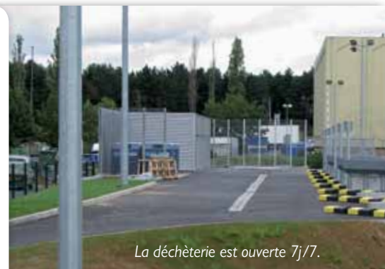
La déchèterie est ouverte 7j/7.