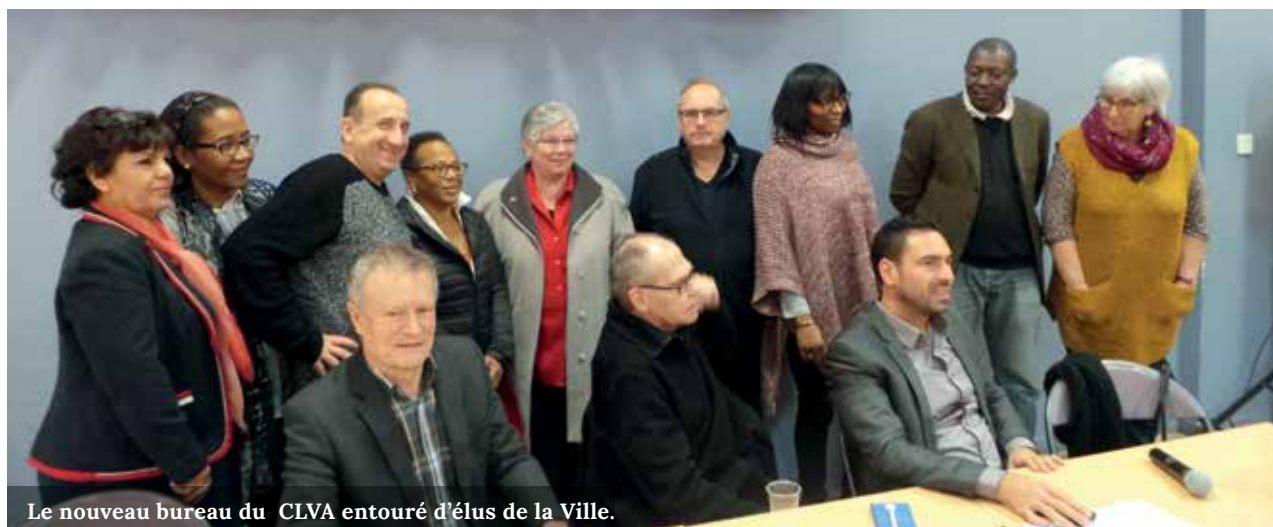
Le nouveau bureau du CLVA entouré d'élus de la Ville.