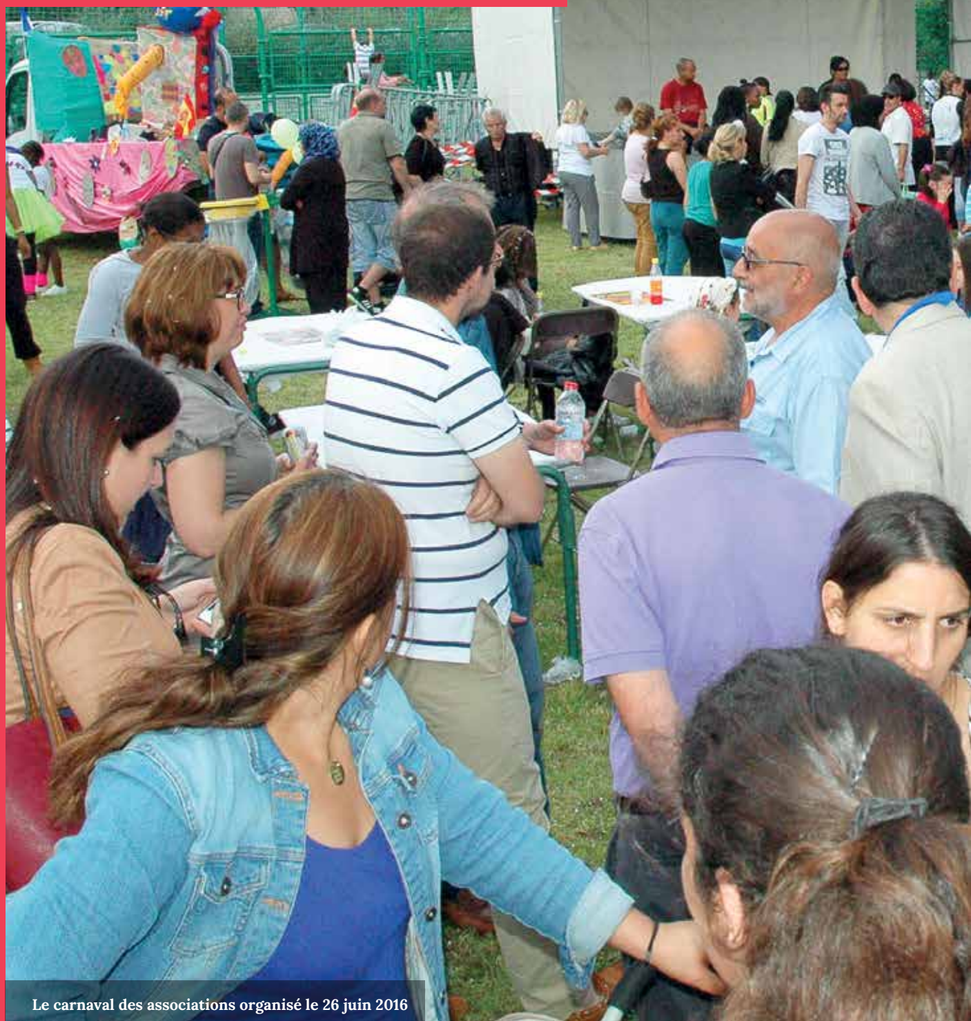
Le carnaval des associations organisé le 26 juin 2016