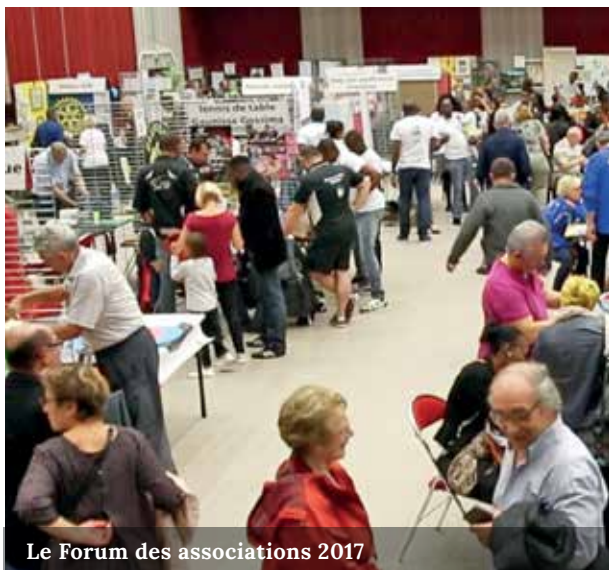
Le Forum des associations 2017