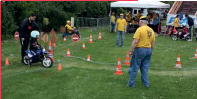
Un atelier prévention routière assuré par l'association Amicale motocycliste val d'oisienne