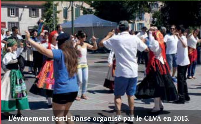
L'évènement Festi-Danse organisé par le CLVA en 2015.