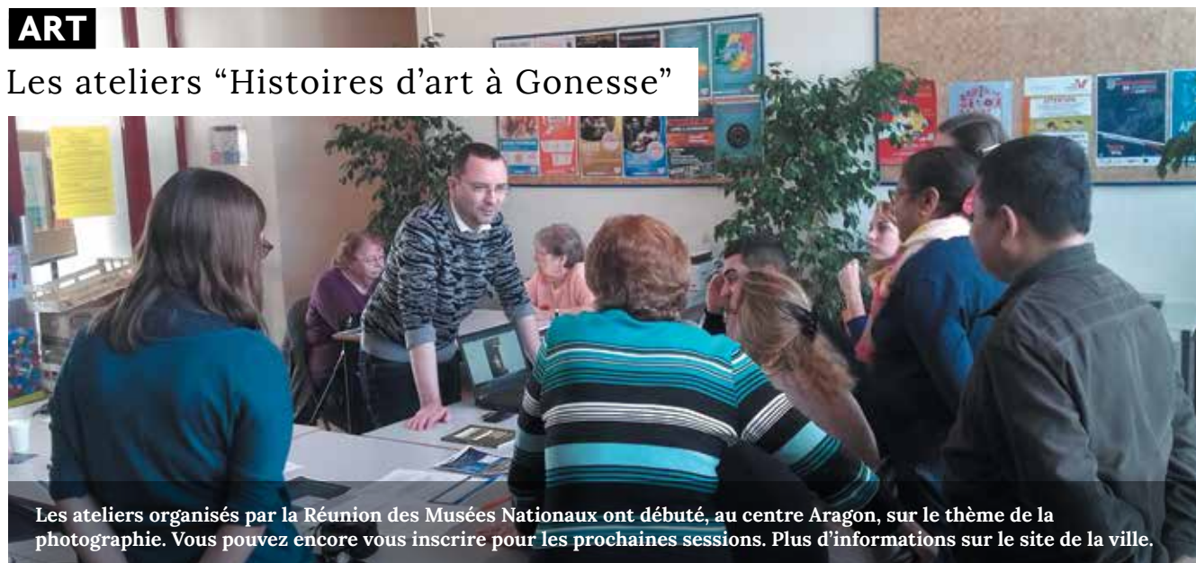
Les ateliers organisés par la Réunion des Musées Nationaux ont débuté, au centre Aragon, sur le thème de la photographie. Vous pouvez encore vous inscrire pour les prochaines sessions. Plus d'informations sur le site de la ville.