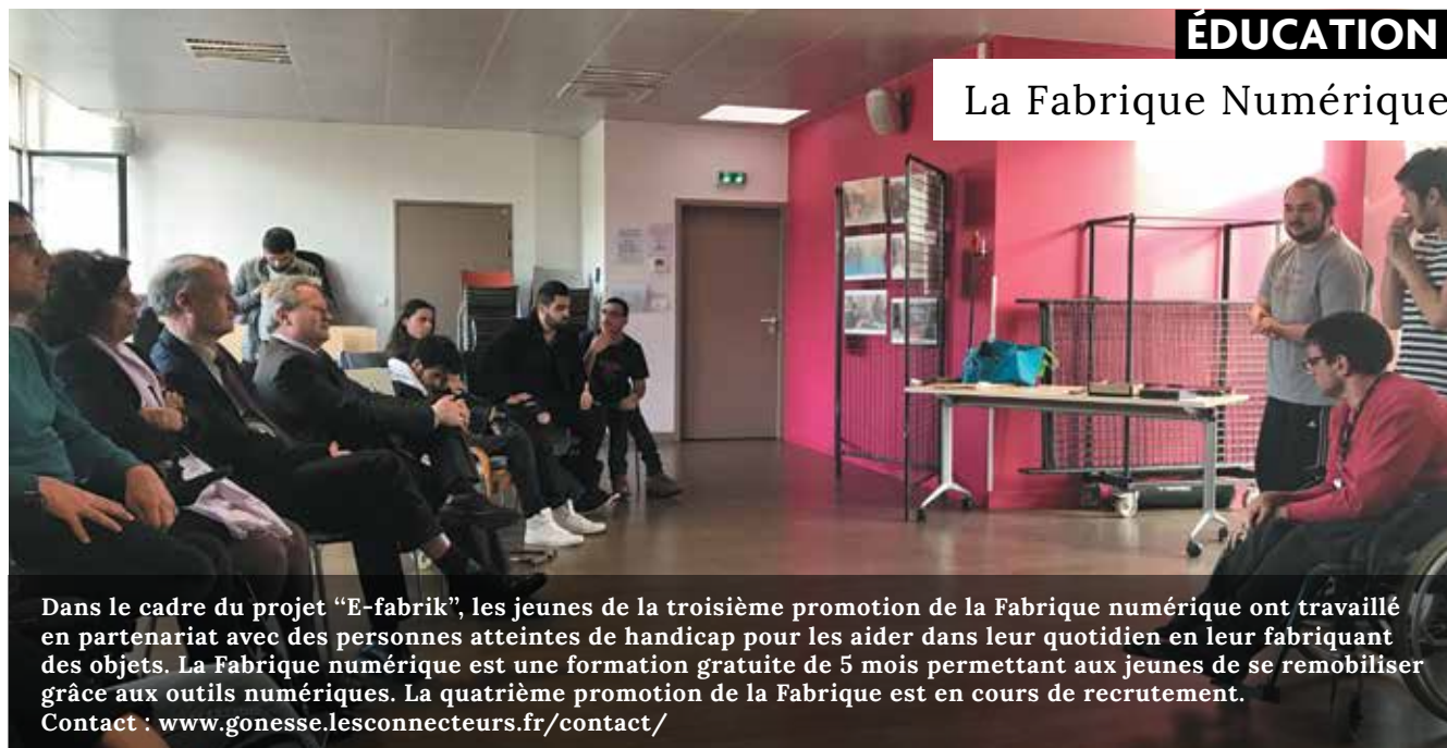
Dans le cadre du projet “E-fabrik”, les jeunes de la troisième promotion de la Fabrique numérique ont travaillé en partenariat avec des personnes atteintes de handicap pour les aider dans leur quotidien en leur fabriquant des objets. La Fabrique numérique est une formation gratuite de 5 mois permettant aux jeunes de se remobiliser grâce aux outils numériques. La quatrième promotion de la Fabrique est en cours de recrutement. Contact : www.gonesse.lesconnecteurs.fr/contact/