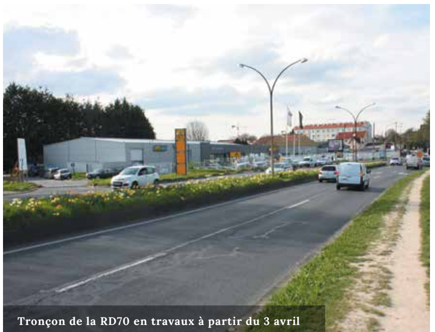
Tronçon de la RD70 en travaux à partir du 3 avril

Les travaux de la rue Nungesser et Coli ne sont que la première phase de travaux qui vont se poursuivre tout le long de la route départementale jusqu'au rond point du BIP en 3 phases. Le Conseil départemental s'est engagé à poursuivre les travaux pour permettre à la voie de bus de continuer jusqu'au rond-point Berthelot.