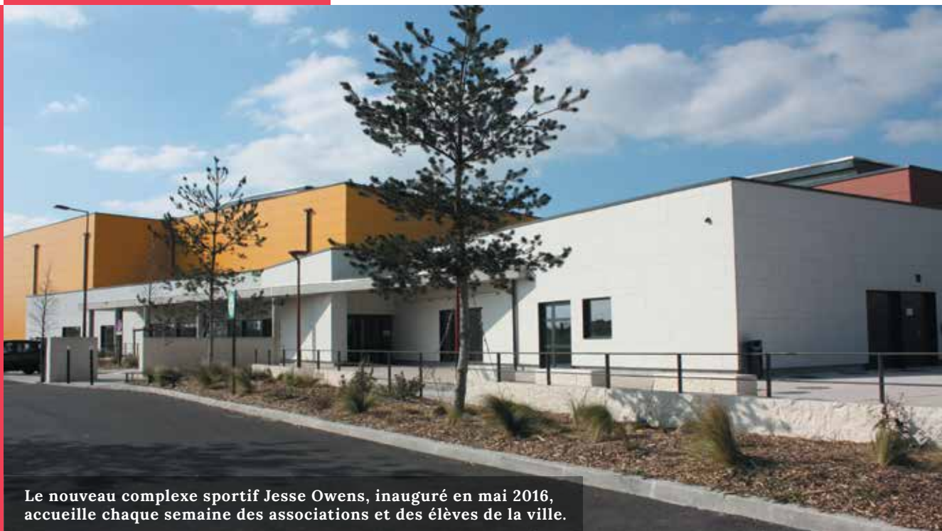
Le nouveau complexe sportif Jesse Owens, inauguré en mai 2016, accueille chaque semaine des associations et des élèves de la ville.

L'obtention du label "Ville active et sportive" récompense en premier lieu le travail de tous les éducateurs sportifs. La Ville compte en effet huit éducateurs sportifs qui ont chacun une spécialisation dans un sport et sont très actifs dans les associations sportives. Leur mission est essentielle également pour la pratique du sport à l'école. Dans les écoles élémentaires de la Ville, les éducateurs sportifs soutiennent les professeurs des écoles dans les animations sportives qu'ils doivent mettre en place. Les éducateurs interviennent aussi hors du temps scolaire lors des Temps d'activités périscolaires. Ils permettent ainsi à des élèves de classes élémentaires de découvrir de nouvelles pratiques sportives pendant les vacances. Ils proposent également aux adolescents des activités sportives pendant une semaine lors des vacances scolaires dans le cadre de l'école municipale des sports (voir page 7)