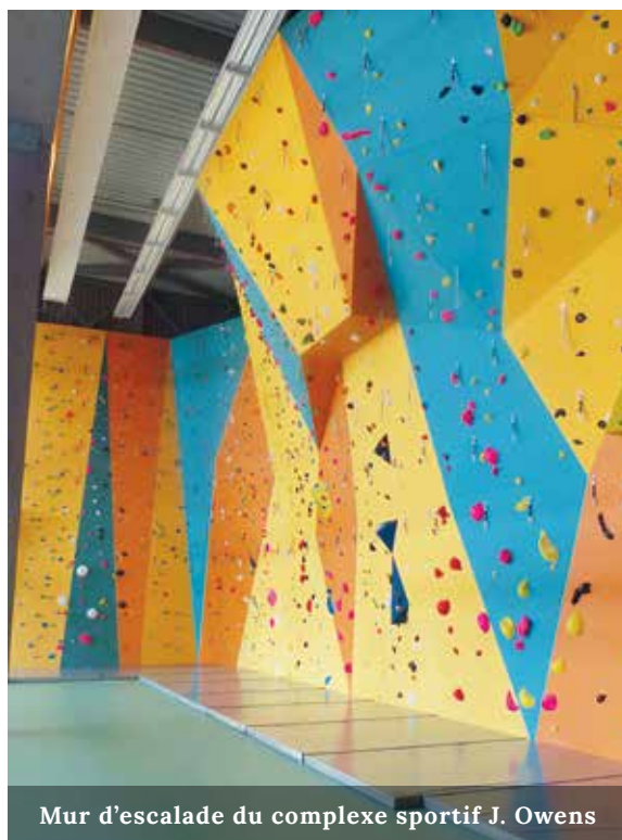
Mur d'escalade du complexe sportif J. Owens