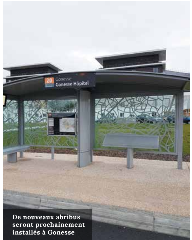
De nouveaux abribus seront prochainement installés à Gonesse

Le BHNS est un bus en site propre (disposant de ses propres voies de circulation) permettant aux Gonessiens de traverser la ville rapidement pour rejoindre le RER D (gare d'Arnouville, Villiers-le-Bel, Gonesse) ou le RER B (gare du Parc des expositions de Villepinte). Avec une fréquentation de 500 usagers par jour à son lancement, ce nouveau moyen de transport est vite monté en puissance avec 2 500 passagers par jour en janvier et 4 000 au mois de mars.