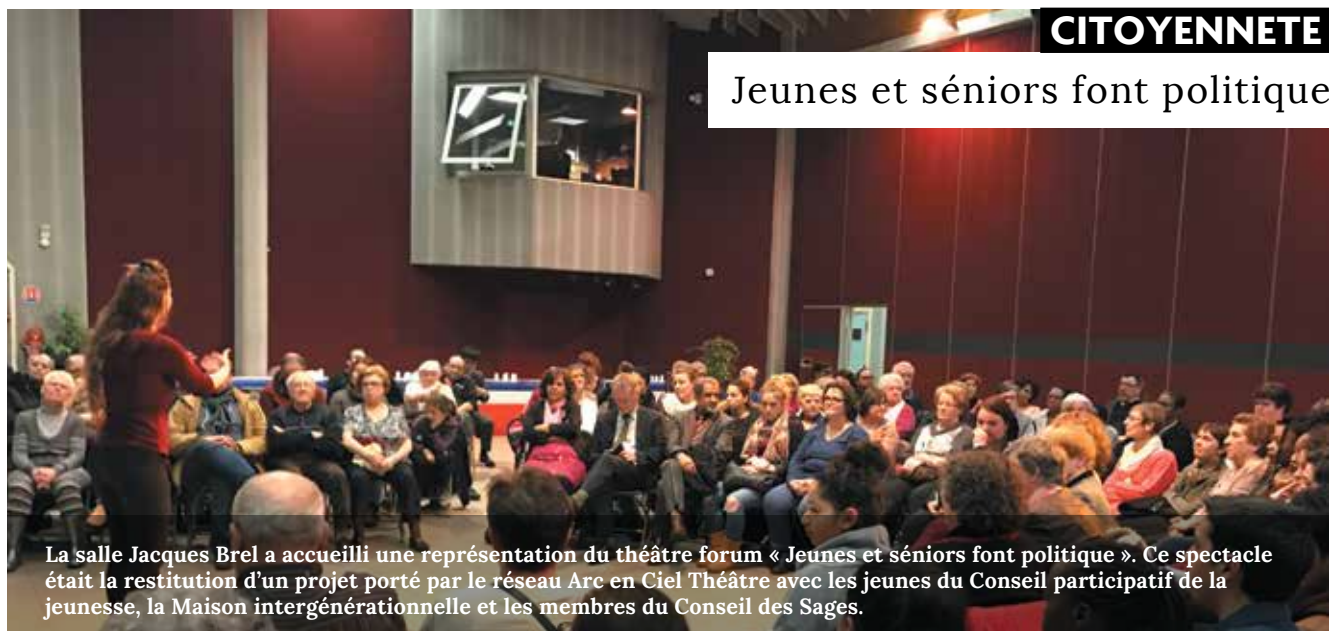
La salle Jacques Brel a accueilli une représentation du théâtre forum « Jeunes et seniors font politique ». Ce spectacle était la restitution d'un projet porté par le réseau Arc en Ciel Théâtre avec les jeunes du Conseil participatif de la jeunesse, la Maison intergénérationnelle et les membres du Conseil des Sages.