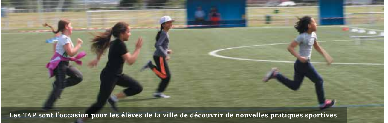
Les TAP sont l'occasion pour les élèves de la ville de découvrir de nouvelles pratiques sportives

Les Foulées gonessiennes ont en octobre dernier, connu également un grand succès avec 510 participants soit plus que les autres années. Ces foulées sont, à l'image de la politique sportive municipale, destinées à tous. Les différentes courses permettent à de nombreux coureurs de participer quelque soit leur niveau. Cela fait des Foulées gonessiennes un événement particulièrement convivial. Le tournoi de judo fait également partie de cette catégorie des temps forts de l'année sportive. 634 participants (record de participation) pour 17 clubs privés sont venus concourir cette année. Enfin, à destination des enfants, les fameux Jeux de Gonesse regroupent chaque année 1000 enfants gonessiens.