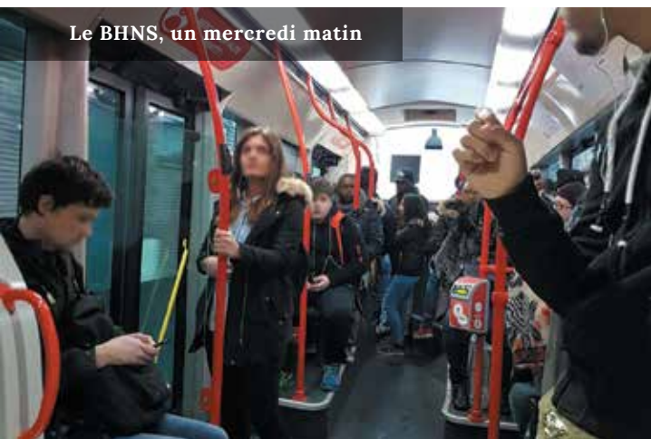
Le BHNS, un mercredi matin

La réunion publique du 14 mars qui a rassemblé près de 70 personnes a permis à des habitants (notamment des signataires d'une pétition) d'exprimer aux élus et aux transporteurs présents certaines remarques et réclamations. Il a notamment été demandé le lancement d'une réflexion pour la desserte de l'hôpital par la ligne 23, l'itinéraire du 95-02, la desserte de la ligne Filéo en centre-ville pour rejoindre la plateforme aéroportuaire, une diminution de la fréquence du BHNS après 21h pour renforcer les passages de la ligne 23 le soir, l'amélioration de l'affichage des horaires sur les arrêts et l'implantation de nouveaux abribus. Ces demandes font actuellement l'objet d'études d'opportunité et de faisabilité financière.