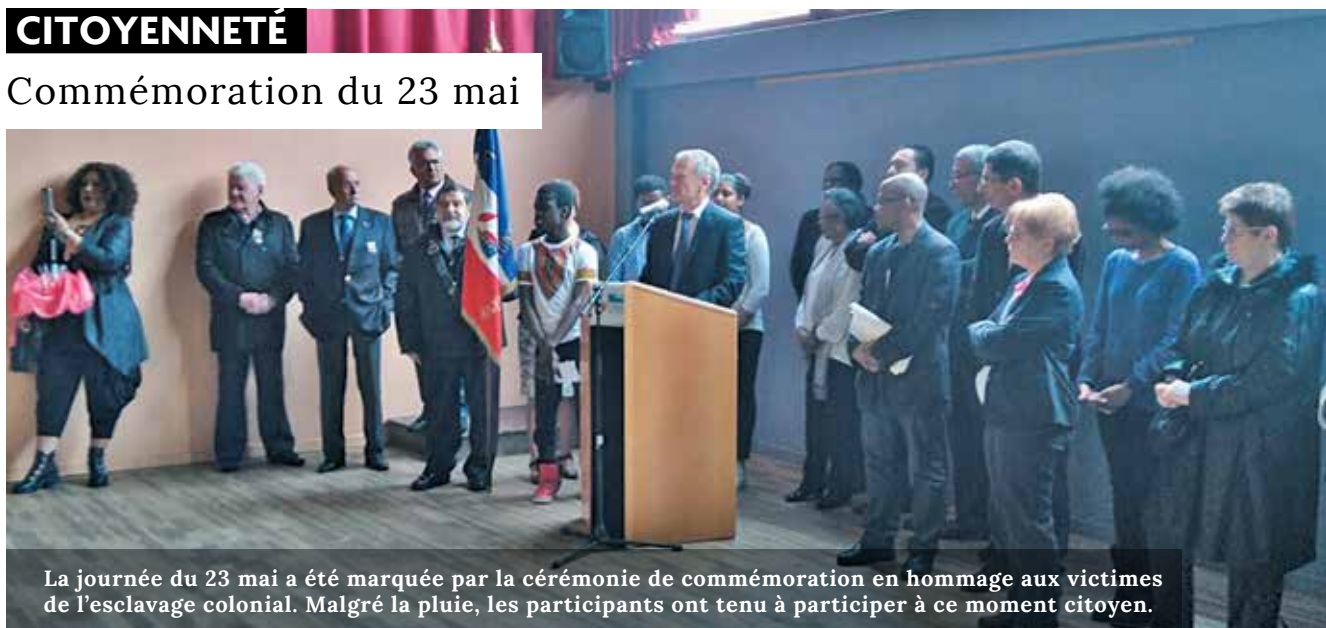
La journée du 23 mai a été marquée par la cérémonie de commémoration en hommage aux victimes de l'esclavage colonial. Malgré la pluie, les participants ont tenu à participer à ce moment citoyen.