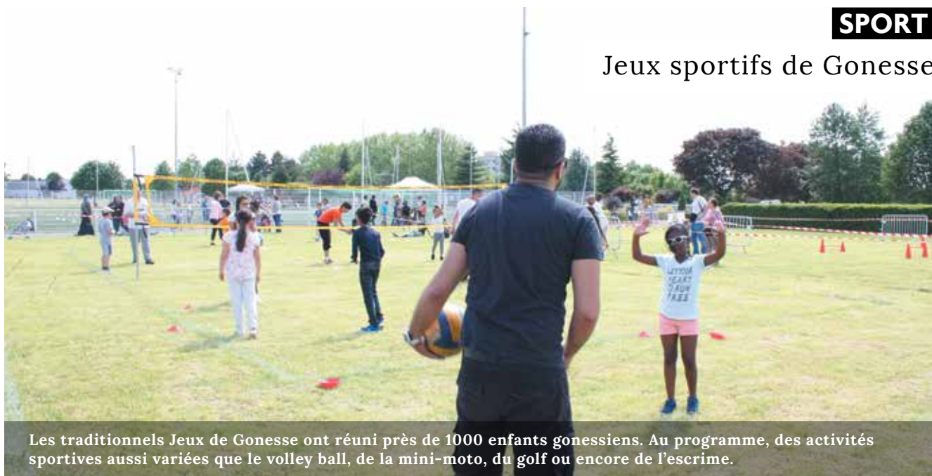
Les traditionnels Jeux de Gonesse ont réuni près de 1000 enfants gonessiens. Au programme, des activités sportives aussi variées que le volley ball, de la mini-moto, du golf ou encore de l'escrime.