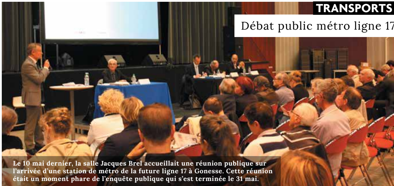
Le 10 mai dernier, la salle Jacques Brel accueillait une réunion publique sur l'arrivée d'une station de métro de la future ligne 17 à Gonesse. Cette réunion était un moment phare de l'enquête publique qui s'est terminée le 31 mai.