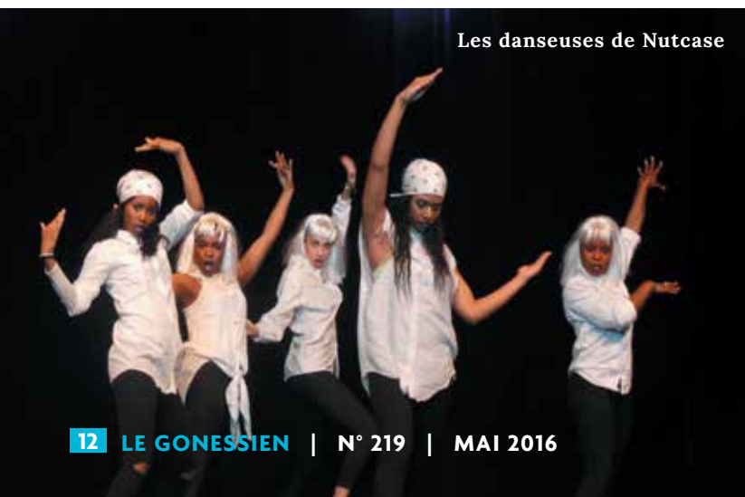
Les danseuses de Nutcase