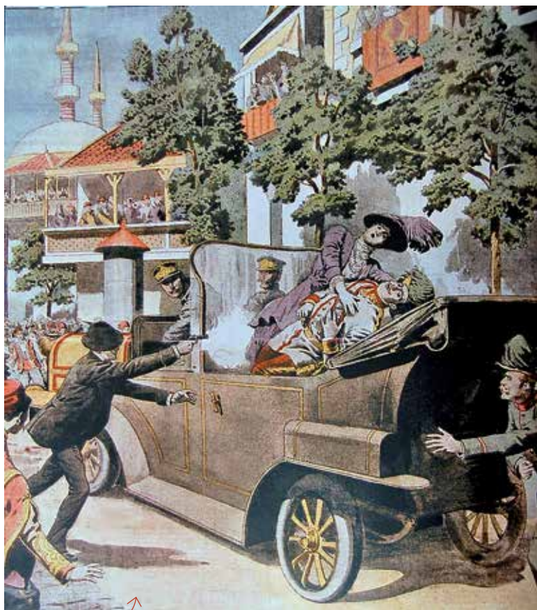
Une du Petit Journal du 12 juillet 1914

Enfin une page du Gonesien entièrement consacrée à cette thématique sera publiée au moins 1 fois par trimestre en collaboration avec l'association Patrimonia.