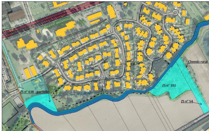
Aménagement de lutte contre les inondations et valorisation du milieu naturel Quartier du Vignois à Gonesse

Dans le cadre d'une opération de lutte contre les inondations et pour la valorisation du milieu rural, un aménagement de la zone d'expansion de crue a été réalisé dans le quartier du Vignois à Gonesse.