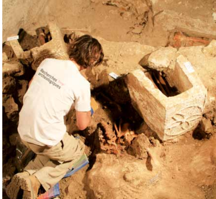
↑ Archéologue de l'inrap faisant un relevé de sépulture mérovingienne, à droite un pied de sarcophage du VII e siècle décoré d'une rouelle.

La seconde phase de fouilles, qui débute cet été, devrait permettre d'en apprendre plus. Les principales informations sont escomptées de la fouille du bas-côté nord, concernent un mur de 2 mètres de large parallèle à la façade occidentale découvert lors des sondages, en 2010. Les archéologues